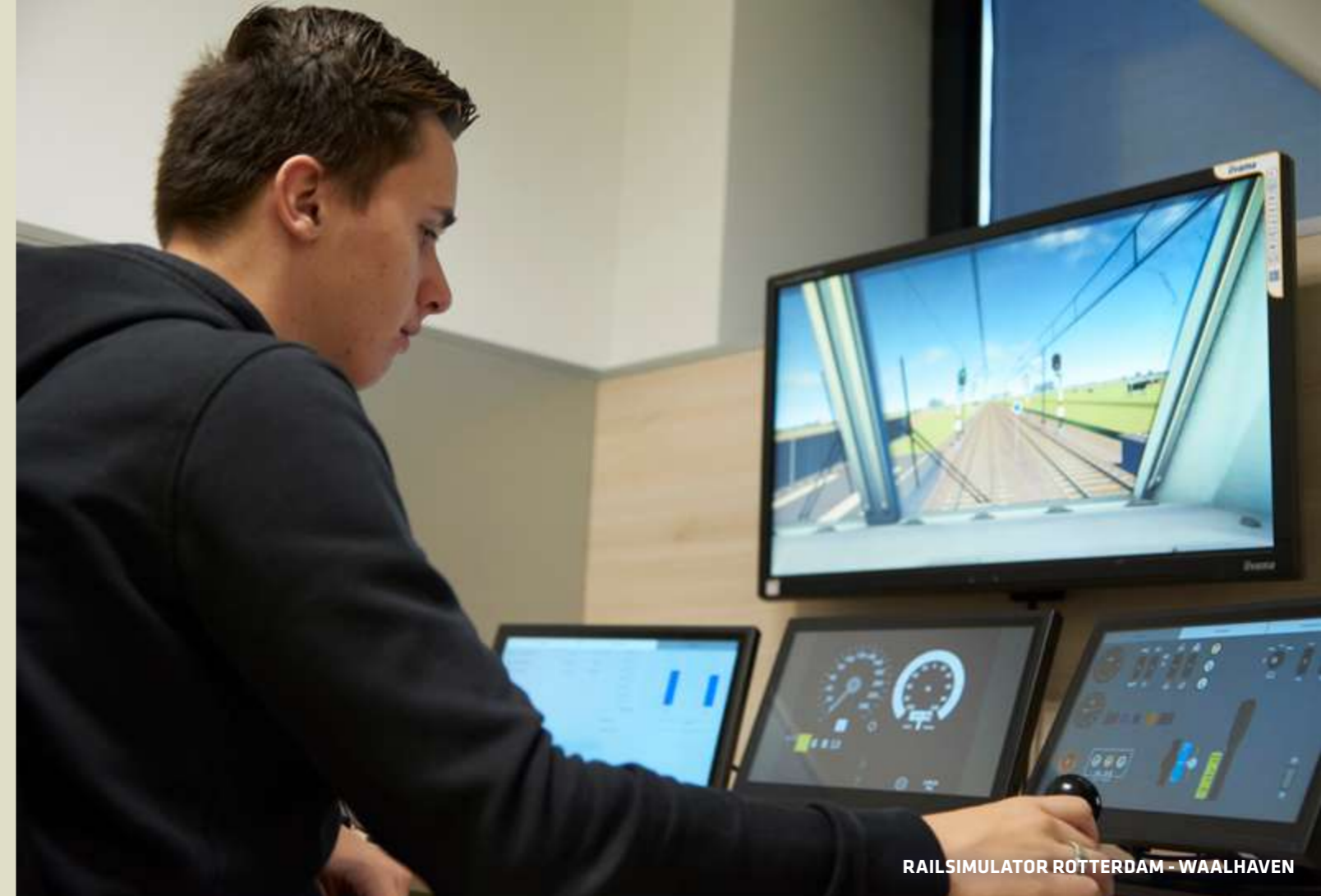
RAILSIMULATOR ROTTERDAM - WAALHAVEN