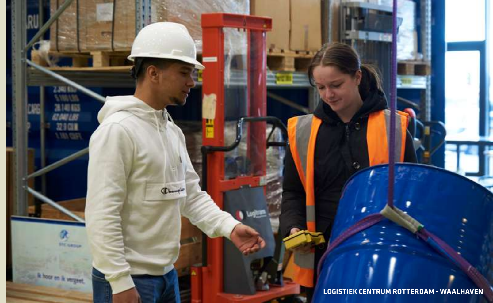
LOGISTIEK CENTRUM ROTTERDAM - WAALHAVEN