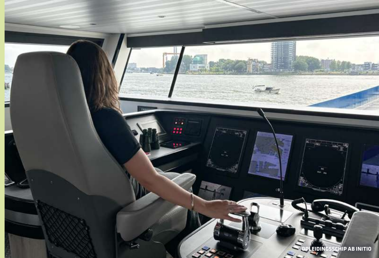
OPLEIDINGSSCHIP AB INITIO