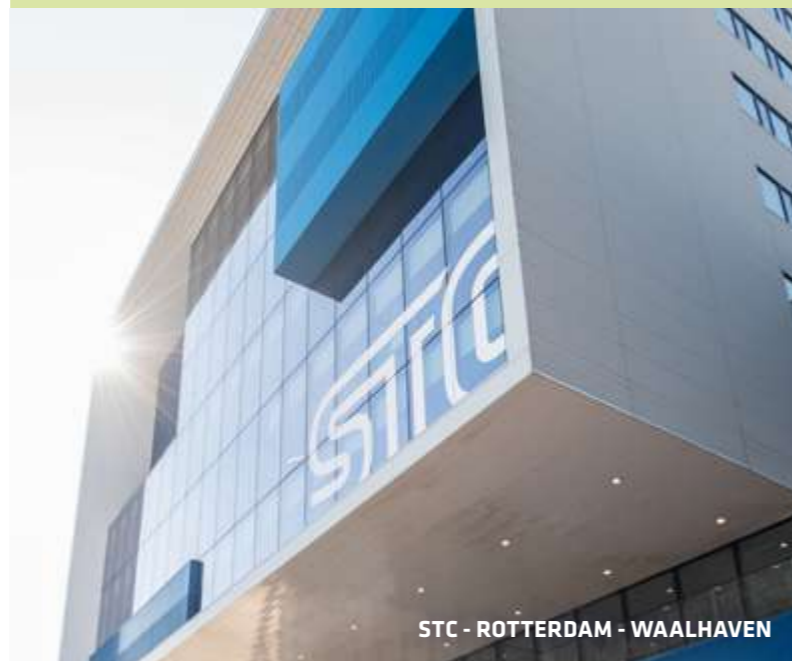
STC - ROTTERDAM - WAALHAVEN

De locatie in Brielle is goed te bereiken met de bus. De bus stopt op ongeveer tien minuten lopen van de school. Vanaf Rotterdam Centraal Station duurt het ongeveer een uur om in Brielle te komen. Vanaf Spijkenisse Metrostation Centrum is het een half uur. Vanuit Rozenburg en Oostvoorne doe je er ongeveer 25 minuten over.