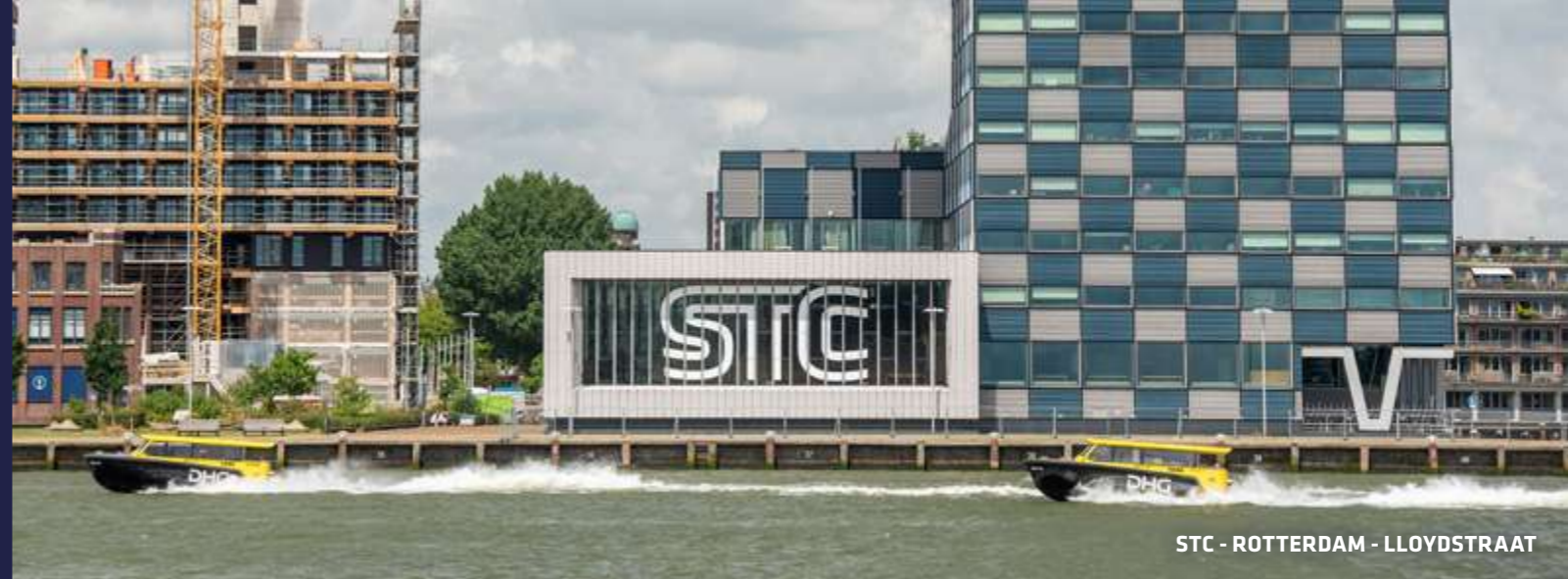
STC - ROTTERDAM - LLOYDSTRAAT

Kies je voor STC, dan kan je terecht op verschillende mbo-locaties.