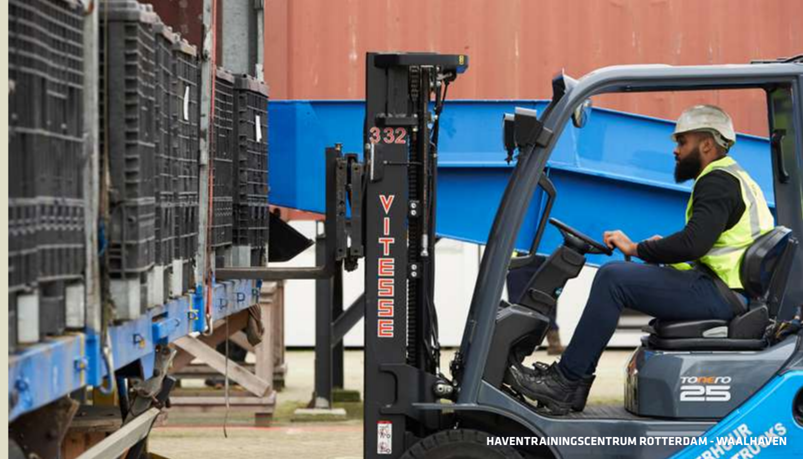
HAVENTRAININGSCENTRUM ROTTERDAM - WAALHAVEN

Scan de QR-code voor meer info over startdata , locaties en aanmelden .